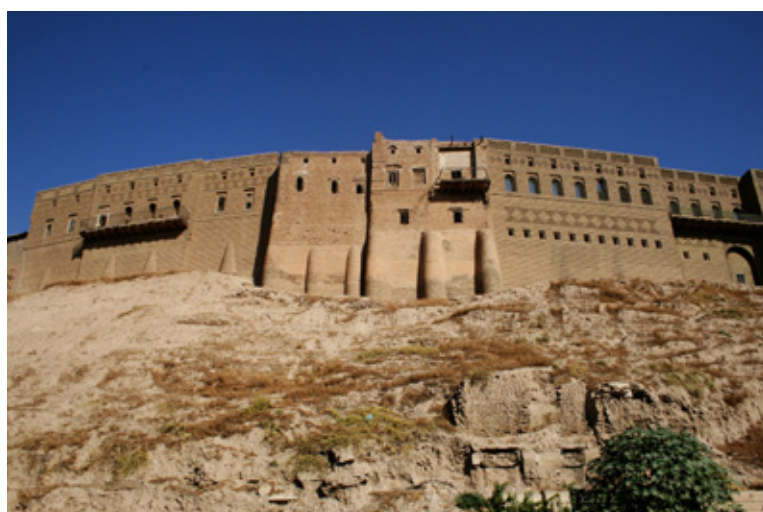
(قهلا ههولیر)، که ۲۲ متر له شاری دهروبهری بهرزتره، یهکنکه لهو شوینه جیهانیانهی که بهدریزی میژوو ناوهدانی لیبوه (ویته: HCHR)

نهم قهلا میژووویه شوینیکی گرنگی ههیه لهناو جهرگهی شاری ههولیر. قهلا گرنگییهکی رمزیی مزنی بو خهلمکی ههردمی کوردستان ههیه و له سالی ۲۰۱۰ وه خراوته لیستی کاتیی