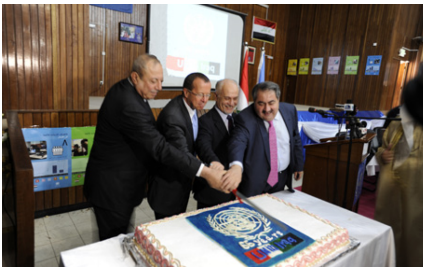
لەچەپەو بۆ راست: جیگری سەرۆک وەزیران رۆژ شاویس و نوێنەری تاییبەتی سکرێتیری گشتیی نەتەو یەگرتوو مەکان مارتن کۆبەر و جیگری سەرۆک وەزیران حوسین شەھەرستانی و وەزیری دەرەو ھۆشباری زبیری لە ناھەنگی یادکردنەوێ رۆژی نەتەو یەگرتوو مەکان لە بەغداد.

نوێنەری تاییبەتی سکرێتیری گشتیی نەتەو یەگرتوو مەکان و سەرۆکی نێردەي نەتەو یەگرتوو مەکان بۆ ھاریکاری عیراق (یونامی) مارتن کۆبەر ھەندێ لە دەسکەوتە شاکار مەکانی نەتەو یەگرتوو مەکانی خستەروو کە گۆرانیان لە ژبانی عیراقییەکان دروست کردووە، بەتایبەتیش لە بوار مەکانی ھەلیژاردن و فەرمانبەری و چاکسازی کەرتی گشتی و سەرورەیی یاسا و دژ مەندەلی و