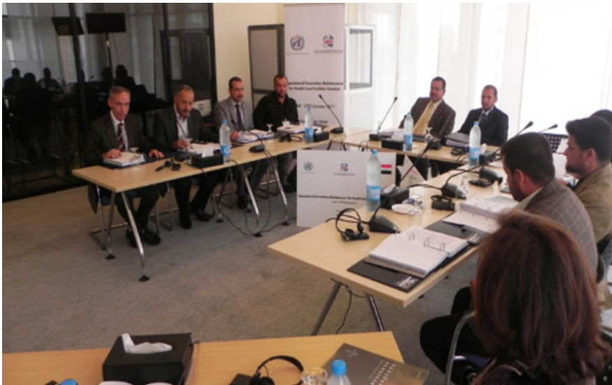
نەندازیاری عێراقی لە ۲۳ تا ۲۷ تشرینی یەکەمی ۲۰۱۱ بەشداری لە خۆلێکی پێشکەوتوو دەکەن سەبارەت بە کارپێکردن و بابەخدانی رێگر بۆ دەزگاکانی چاودێری تەندروستی.

یەکگرتووێکمان لە عێراق و رێکخراوی یونیسف بە نیشانەدەرە نامارییەکانی پەیموست بەمنداڵاندا چوونەوه.