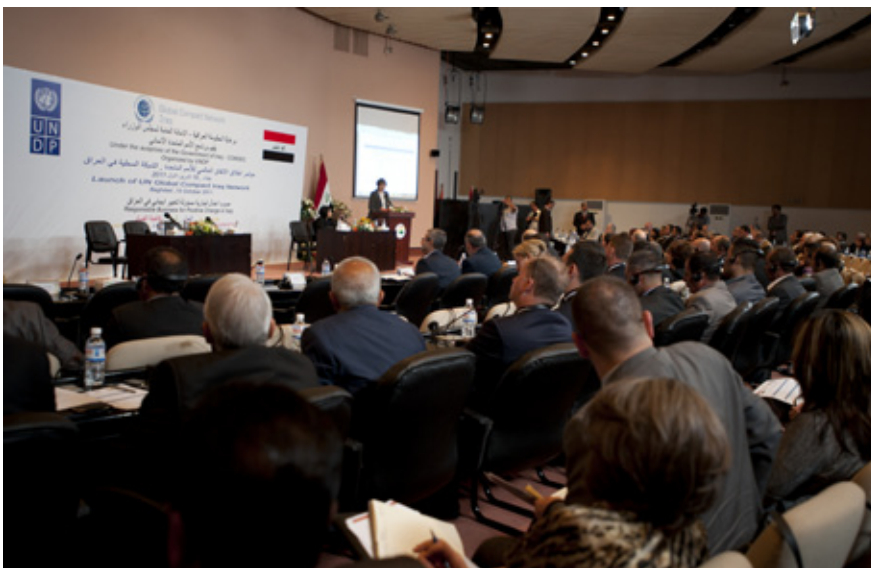
لە ١٥ی تشرینی یەکەمی ٢٠١١ و لە دەسپێکی راگەیانندی (ریککەوتنامە جیهانی) دا، جیگری نوێنەری تاییەتی سکر تیری گشتیی نەتەوه یەکگرتووێکان و هەماهەنگسازی نیشتەجی و مەژووی لە عێراق خاتوو کریستین ماکناب قسە بۆ بەشداربووان دەکات لە بەغداد.

بەشداران لە (نوسینگە) ناماری ناوئەندی و (نوسینگە) ناماری هەریمی کوردستان) و چەند زانکۆیەکی رۆژەهلاتی ناوئەندی و سندوقی دراوی نیوئەولەتی و نازانسهکانی نەتەوه