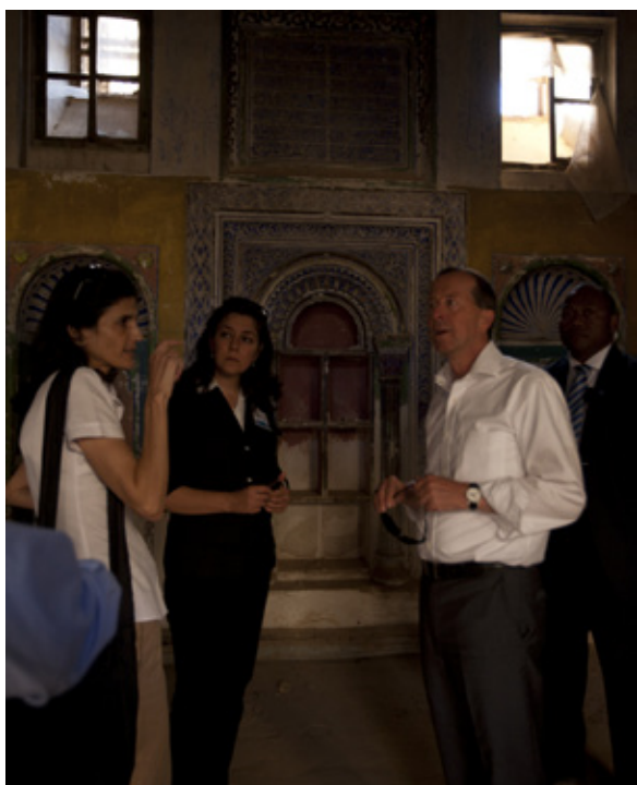
نوینەری تالیبەتی سكرتیری گشتیی نەتەوه یەكگرتوو هەكان مارتن كۆبڵەر لە ٢٢ تشرینی یەكەمی ٢٠١١ بەناو قەلای مێژوویی هەولێردا.

بەرێز زیباری و تیشی "حكومەتی عێراق پەيوەندییەكى پنهوی لەگەڵ یونامیدا هەیه و ئەو دەورەش كە نازانسهكانی نەتەوه یەكگرتوو هەكان گێراویانە لە ئاوەدانكردنەوه و تواناسازی لە عێراق بەراستی پڕبەهیه. بەلام، وێرای داننان بە كار و دەسكەوتەكانی ئەو نازانسانە، گەرنگیشە ناماژە