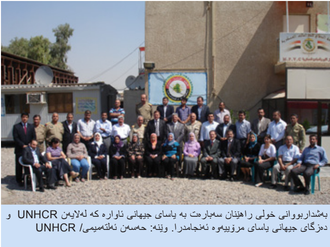
بەشداربووانی خولی راهبێان سەبارەت بە یاسای جیهانی ناواری کە لەلایەن UNHCR و دەزگای جیهانی یاسای مروییەو ئەنجامدرا.