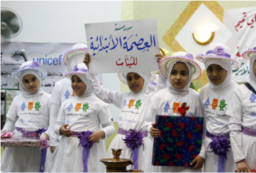
له ناهنگی چوارمین یادی (روژی جیهانیی دستشوردن) دا مندانانی عراق بهشدرای له چالاکیهکان دهکن و گرنگی دهست به سابوون شوردنیش دهر دمخس

یادیکی نیشتمانی پیرهو دهکن. له عیراقیش، وهزارمهکانی تهنروستی و پهروهده له ۳ ساله ی رابردودا نهم یادهیان کردووهتهوه و بو نهمسالیش همدوو وهزارمهکه گهل یونیسف بهشدرای له یادکردنهویه دهکن.